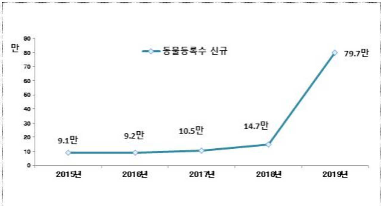
[그림 1] 반려견 신규등록 현황(마리)